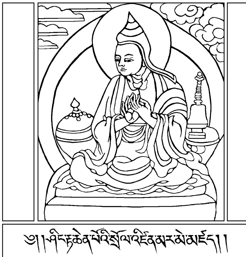
Thánh Atisha (980-1052)

Năm 14 tuổi, Ribur Ripoche vào tu học tại Tu Viện Sera, một trong những viện đại học Phật giáo lớn nhất của dòng Gelug tại thủ đô Lhasa. Ngài bắt đầu ráo riết tu học Phật Pháp. Năm 25 tuổi ngài nhận bằng tiến sĩ Phật học (Geshe degree). Trong thời gian tu học tại Tu Viện Sera, ngài thường đến dự các khóa giảng và nhận nhiều pháp quán đánh từ vị thầy bốn sư là ngài