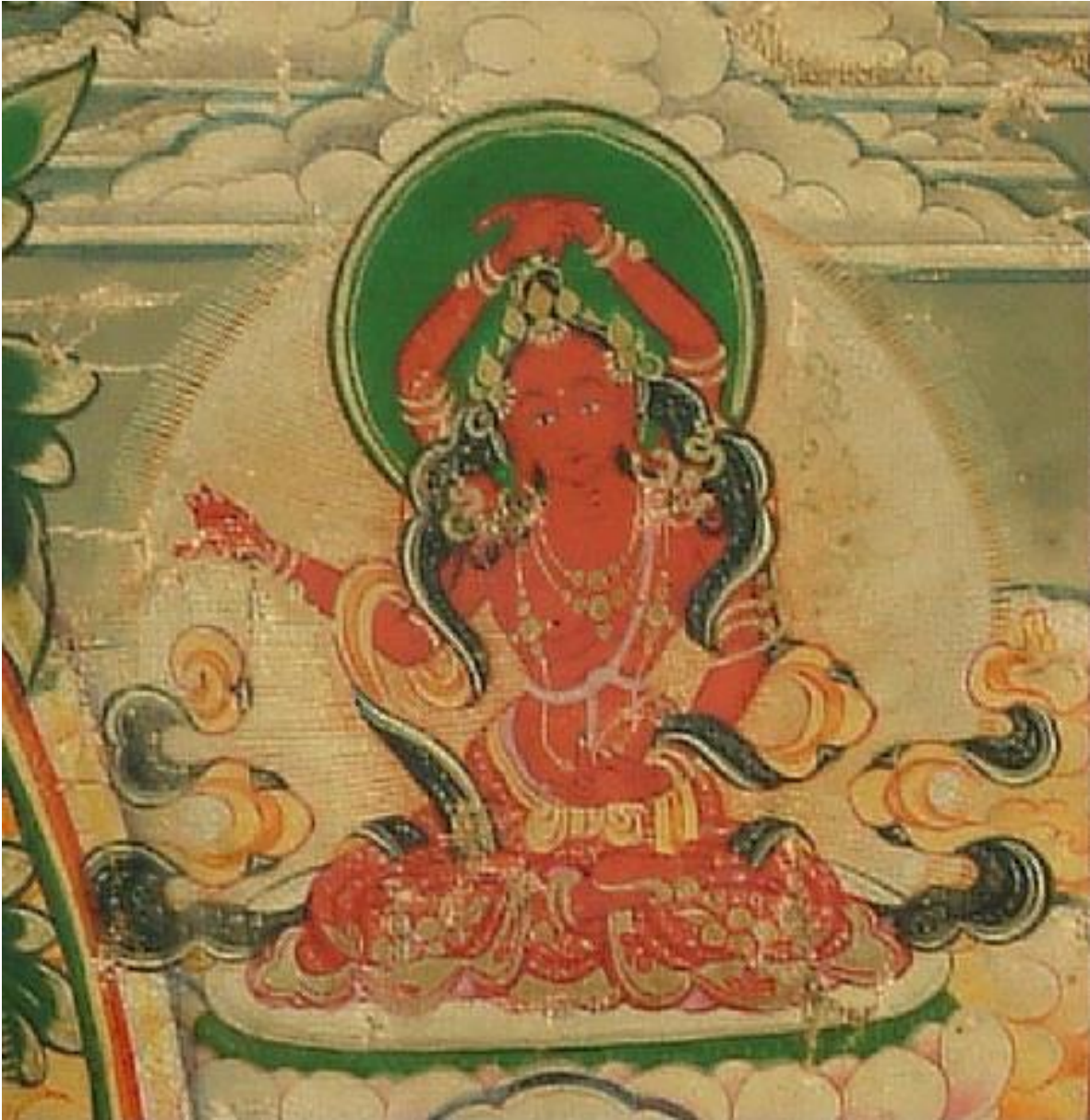
མཚོག་སྤྱོད་བའི་སྤྱོད་མ་

| ཕྱག་འཚལ་དགོན་མཚོག་གསུམ་མཚོན་ཕྱག་རྒྱའི། | སོར་མོས་ཕྱགས་ཀར་རྣམ་པར་བརྒྱན་མ། | མ་ལུས་སྤྱོདས་ཀྱི་འཁོར་ལོས་བརྒྱན་པའི། | རང་གི་འོད་ཀྱི་ཚོགས་རྣམས་འབྲུག་མ། །།།