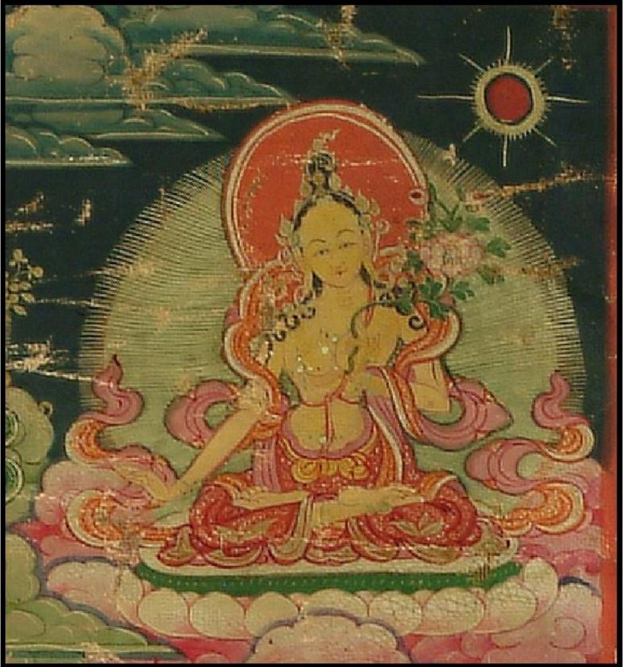
ཕྱི་རྒྱ་སྒྲོག་པའི་སྒོལ་མ་

| ཕྱག་འཚལ་དུ་རྩེ་ར་ཕྱི་ཡི་གོས། | འདོད་དང་སྒྲོགས་དང་ནམ་མཁའ་གང་མ། | འཇིག་རྟེན་བདུན་པོ་ཞབས་ཀྱིས་མནན་ཏེ། | ལྷས་པ་མེད་པར་འགྲུགས་པར་རུས་མ། །༥། |