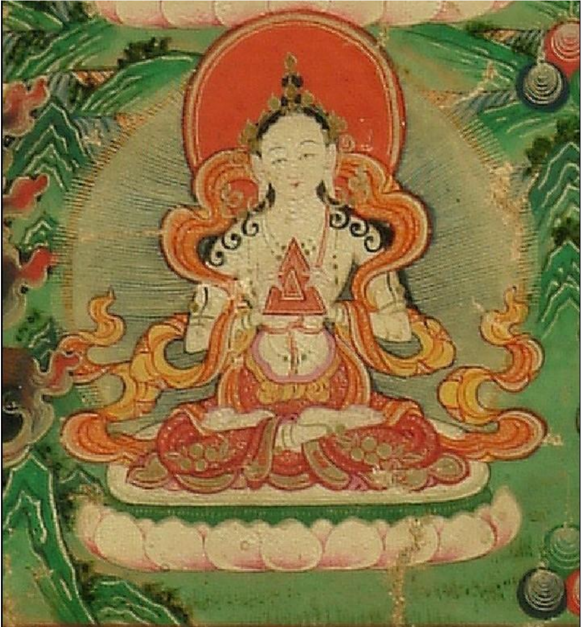
ཕྱག་བསྐྱེད་བསྐྱེད་པའི་སྐྱོལ་མ་

| ཕྱག་འཚལ་སྟེ་ཡི་ཚོགས་རྣམས་རྒྱལ་པོ། | སྟེ་དང་མིའམ་ཅི་ཡིས་བསྐྱེད་མ། | ཀུན་ནས་གོ་ཆ་དགའ་བའི་བརྗིད་ཀྱིས། | ཚེད་དང་མི་ལམ་ངན་པ་སེལ་མ། །།།