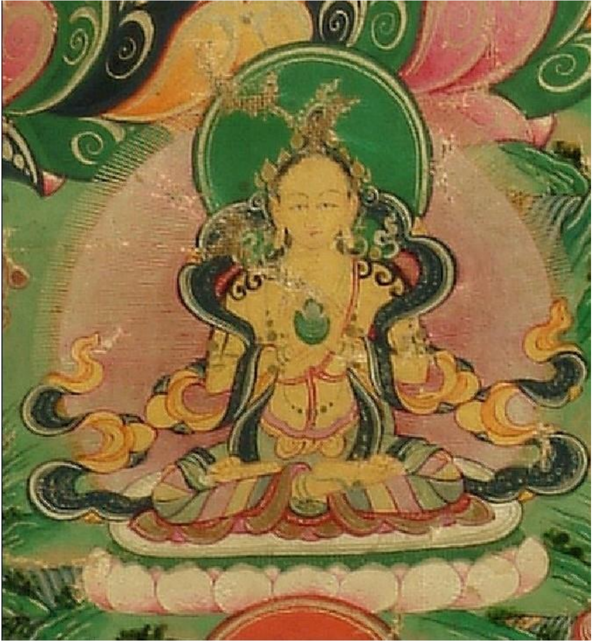
བདེ་བ་རྒྱལ་པའི་སྒྲོལ་མ་

| ཕྱག་འཚལ་དུ་རེ་ཞབས་ནི་བརྟམས་པས། | རྩེ་གི་རྣམ་པའི་ས་བོན་ཉིད་མ། | རི་རབ་མཚུ་ར་དང་འབྲིགས་བྱེད། | འཇིག་རྟེན་གསུམ་རྣམས་གཡོ་བ་ཉིད་མ། །།