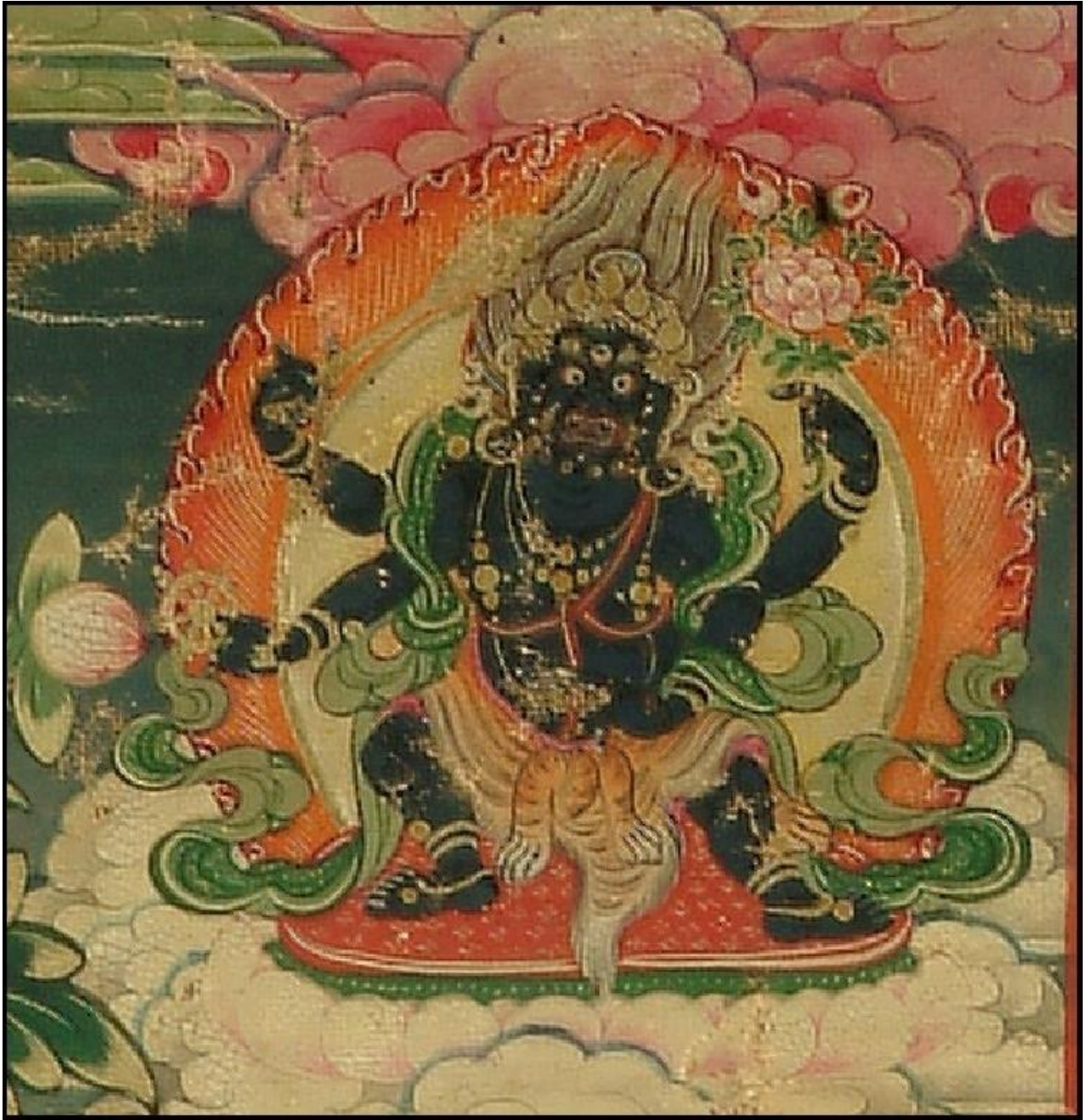
སྐོལ་བ་འཛོམས་པའི་སྐོལ་མ་

| ལྷག་འཚལ་རྟེན་ཅེས་བྱ་དང་ཕན་གྱིས། | བ་རོལ་འབྲུལ་འཁོར་རབ་རྟེན་འཛོམས་མ། | གཡས་བསྐྱམ་གཡོན་བརྒྱུང་ཞབས་གྱིས་མནན་ཏེ། | མེ་འབར་འབྲུག་པ་ཤིན་རྟེན་འབར་མ། །ཎ། །