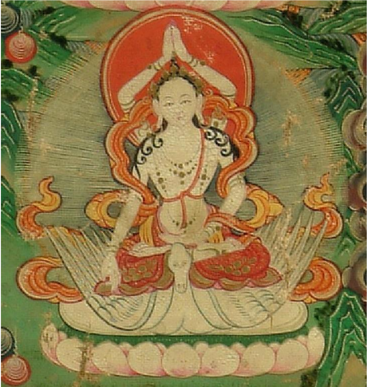
རྣམ་རྒྱལ་མའི་སྒྲོལ་མ་

| རྒྱག་འཚལ་སྣ་ཡི་མཚོ་ཡི་རྣམ་པའི། | རི་དྲགས་ཏྟགས་ཅན་རྒྱག་ན་བསྐྱམས་མ། | རྒྱ་ར་གཉིས་བརྗོད་པར་གྱི་ཡི་གེས། | དུག་རྣམས་མ་ལུས་པར་ནི་སེལ་མ། །།༥།