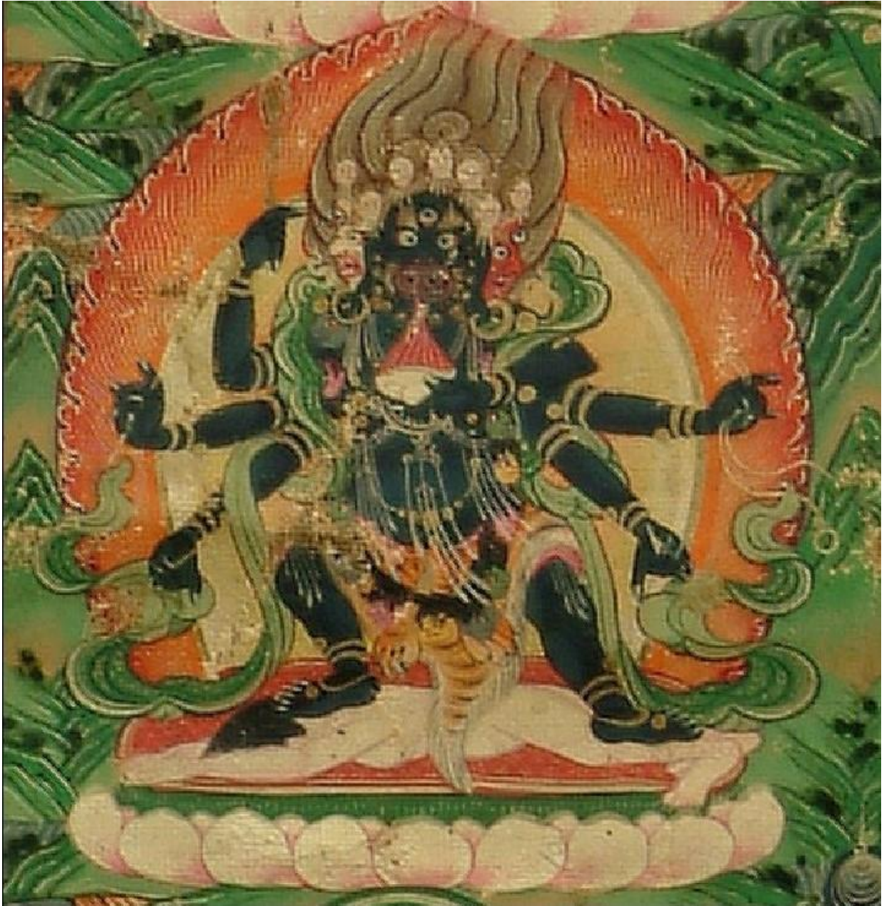
ཁྲོ་གཉེར་ཅན་མའི་སྒྲོལ་མ་

| ལྷུག་འཚལ་ས་གཞིའི་ངོས་ལ་ལྷུག་གོ། | མཐིལ་གྱིས་བསྐྱུན་ཅིང་ཞབས་གྱིས་བརྟུང་མ། | ཁྲོ་གཉེར་ཅན་མཇོང་ཡི་གོ་རྩྱུ་གིས། | རིམ་པ་བདུན་པོ་རྣམས་ནི་འགོམས་མ། །།༥།