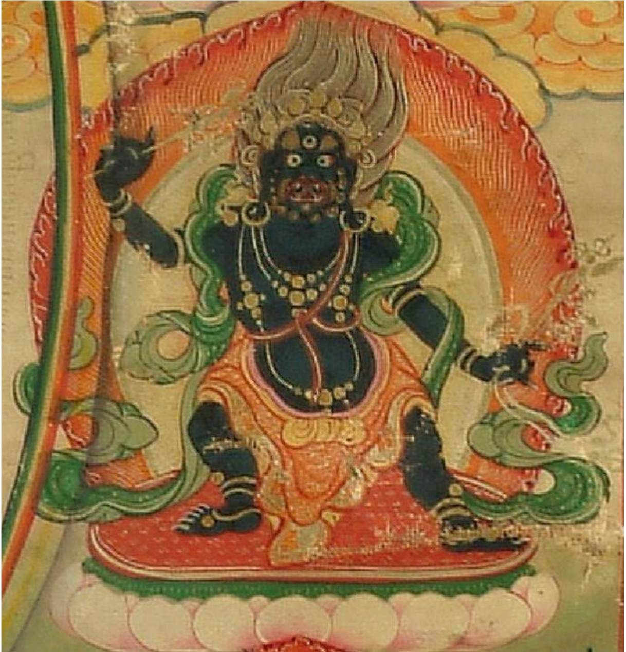
འགྲོ་བ་འགྲུགས་པའི་སྒྲོལ་མ་

| ལྷག་འཚལ་ས་གཞི་སྐྱེད་བའི་ཚྲགས་རྣམས། | ཐམས་ཅད་འགྲུགས་པར་རུས་པ་ཉིད་མ། | ཁྱོ་གཉེར་གཡོ་བའི་ཡི་གེ་རྩུ་གིས། | བོངས་པ་ཐམས་ཅད་རྣམ་པར་སྒྲོལ་མ། །།།