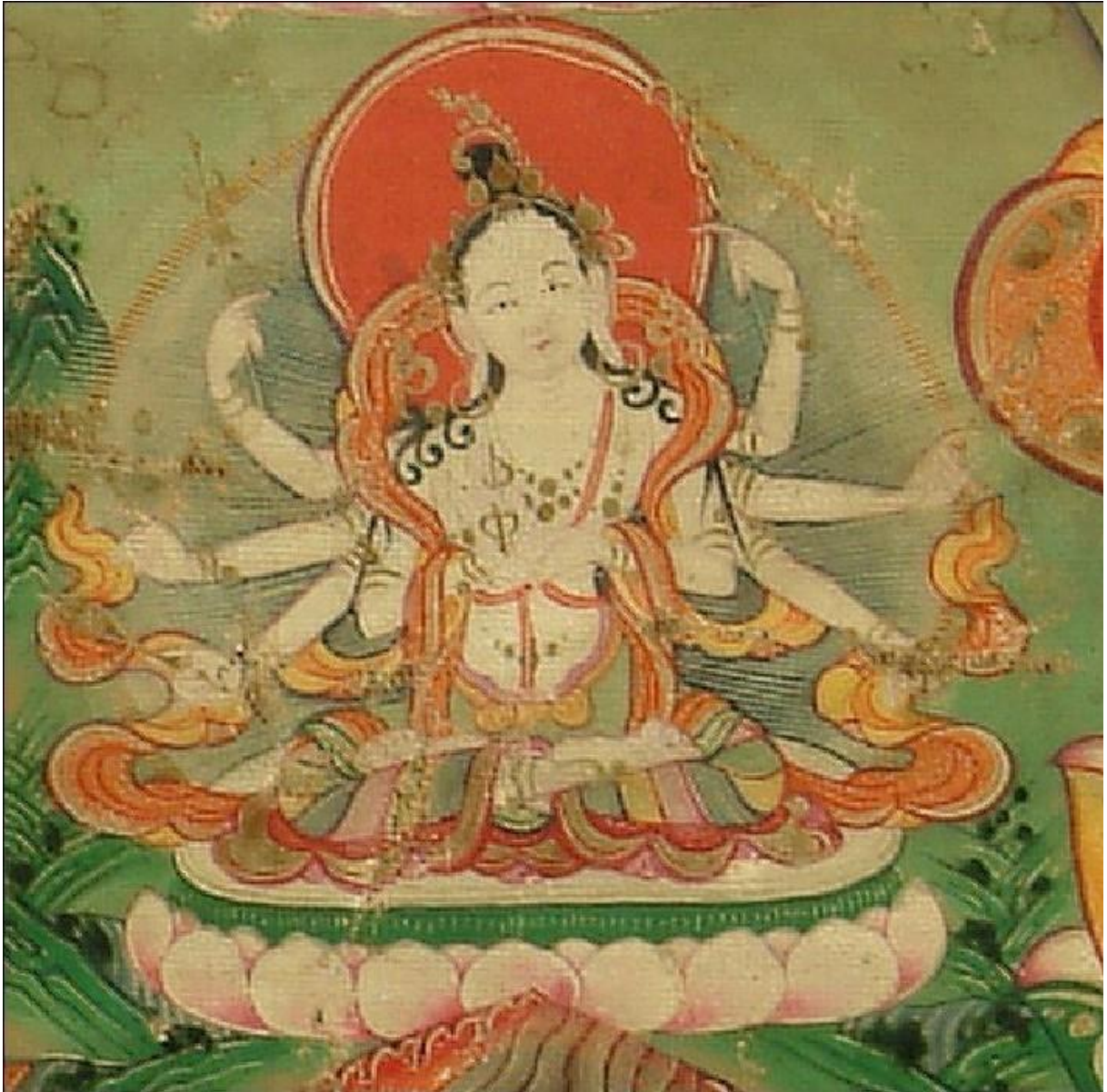
བཀྲ་ཤིས་ལྷ་པོ་བའི་སྒྲོལ་མ་

| སྤྱག་འཚལ་ལྷ་བའི་དུམ་བུས་དབུ་བརྒྱན། | བརྒྱན་པ་ཐམས་ཅད་ཤིན་ཏུ་འབར་མ། | རལ་པའི་ཁྱུར་ན་འོད་དཔག་མེད་ལས། | ཏྱག་པར་ཤིན་ཏུ་འོད་ནི་མཛད་མ། །།།