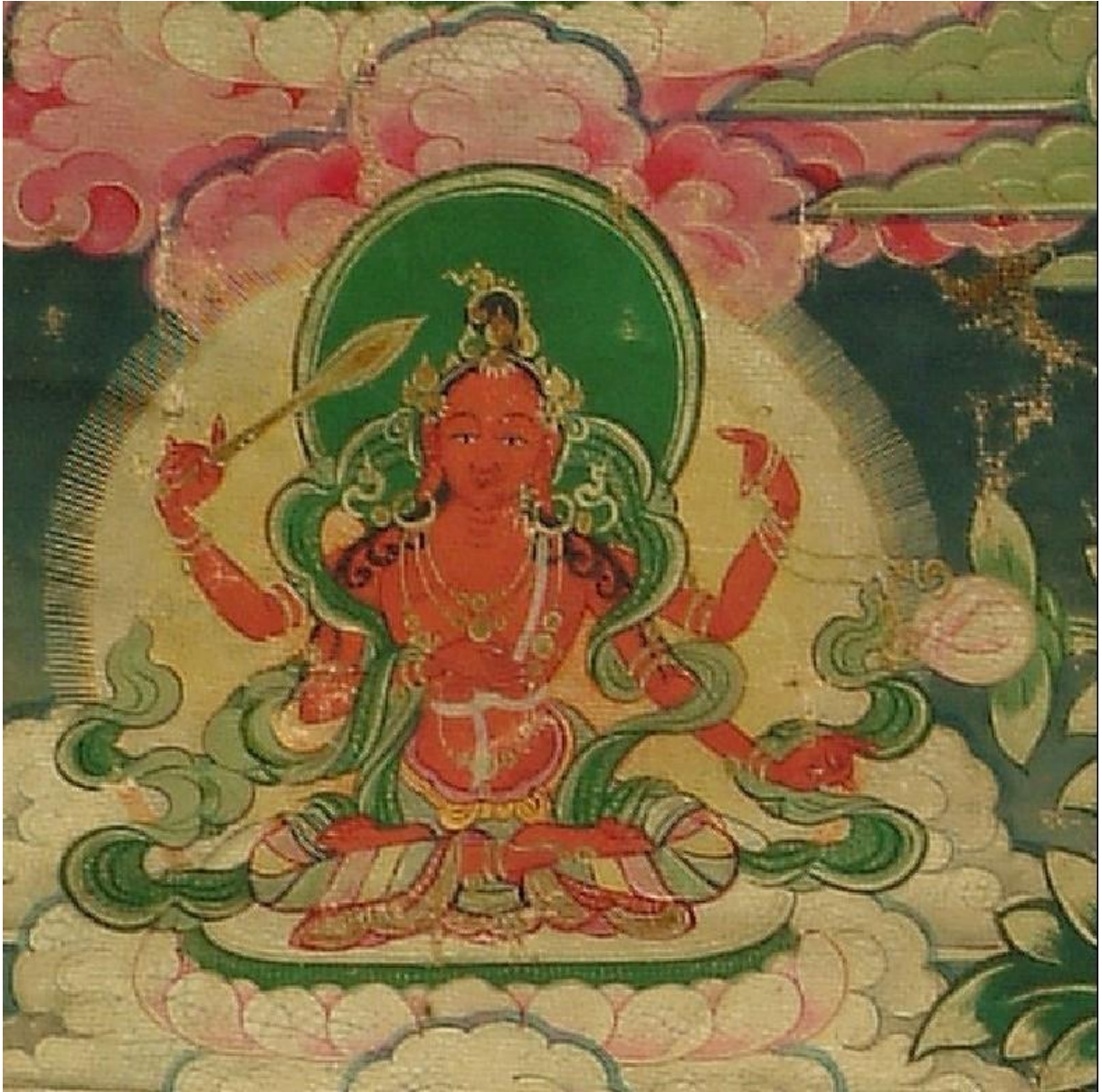
འཇིག་རྟེན་གསུམ་ལས་རྣམ་པར་རྒྱལ་བའི་སྣོལ་མ་

| ཕུག་འཚལ་བརྒྱ་བྱེན་མེ་ལྷ་ཚངས་པ། | རྒྱང་ལྷ་སྣ་ཚོགས་དབང་ཕུག་མཚོད་མ། | འབྲུང་པོ་རོ་ལངས་ཏྲི་བ་རྣམས་དང་། | གཞོད་སྣོན་ཚོགས་ཀྱིས་མདུན་ནས་བསྟོད་མ། །༦།