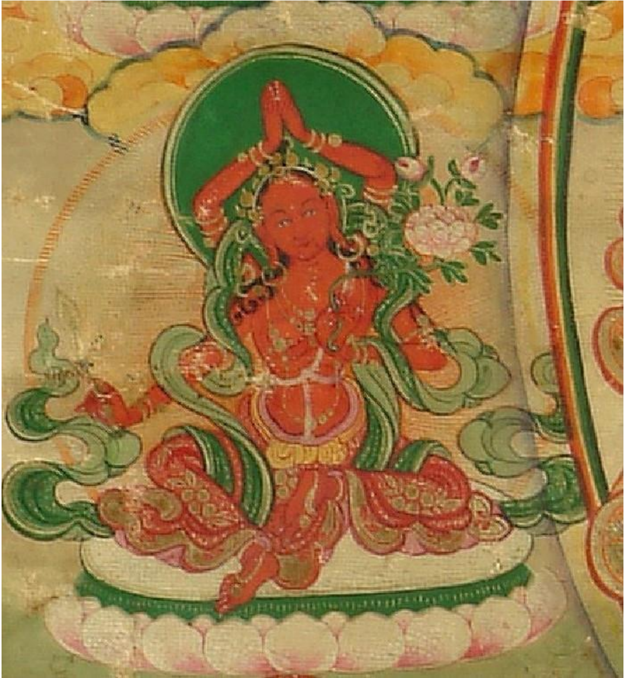
ལྷ་ངན་སེལ་བའི་རྫོལ་མ་

| ལྷག་འཚལ་རབ་དུ་དགའ་བ་བརྗེད་པའི། | དབུ་རྒྱན་འོད་གྱི་སྤེང་བ་སྤེལ་མ། | བཞད་པ་རབ་བཞད་དུ་རྩེ་ར་ཡིས། | བདུད་དང་འཇིག་རྟེན་དབང་དུ་མཛད་མ། །།