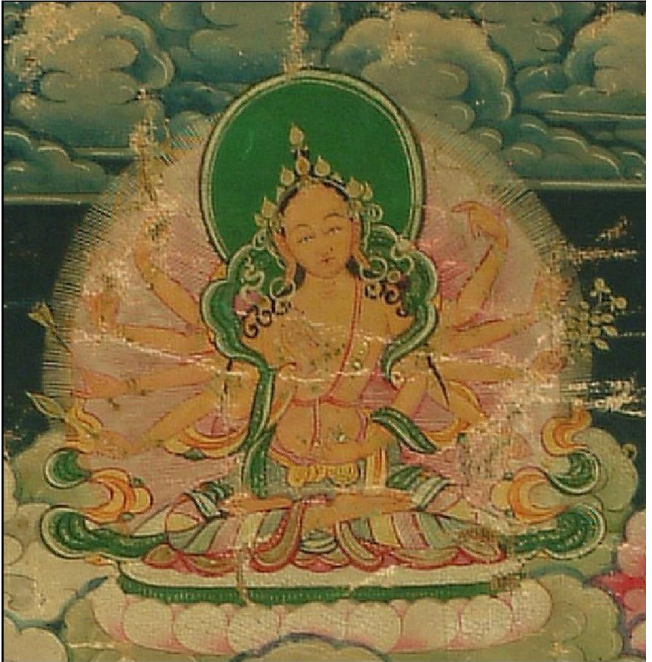
གསེར་མདོག་ཅན་གྱི་སྒྲོལ་མ་

| ལྷག་འཚལ་གསེར་སྒྲོ་ཚུ་ནས་སྐྱེས་གྱི། | བརྒྱས་ལྷག་ནི་རྣམ་པར་བརྒྱན་མ། | སྐྱེན་པ་བཙུན་འགྲུས་དཀར་ལྷབ་ཞི་བ། | བཟོད་པ་བསམ་གཏན་སྦྱོང་ཡུལ་ཉིད་མ། །༣།