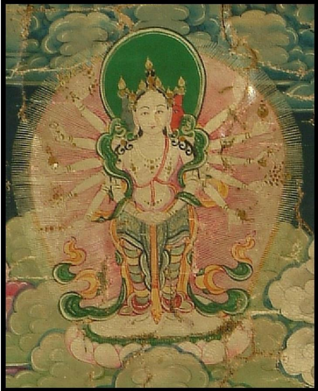
དཀར་མོ་ལྷ་མདངས་ཀྱི་སྒྲོལ་མ་

| ཕྱག་འཚལ་སྟོན་ཀའི་ལྷ་བ་ཀུན་ཏུ། | གང་བ་བརྒྱ་ནི་བརྟེན་པའི་ཞལ་མ། | སྐར་མ་སྟོང་ཕྱག་ཚོགས་པ་རྣམས་ཀྱིས། | རབ་ཏུ་བྱེ་བའི་འོད་རབ་འབར་མ། །༢།