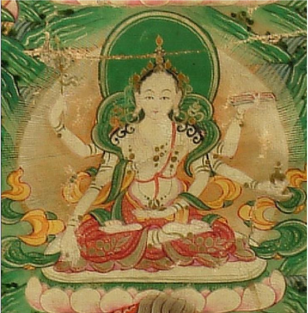
ཞི་བ་ཚེན་ཚེན་མོའི་སྐྱོལ་མ་

| སྐྱུག་འཚལ་བདེ་མ་དག་མ་ཞི་མ། | སྐྱུ་ངན་འདས་ཞི་སྐྱོད་ཡུལ་ཉིད་མ། | སྐྱུ་རྒྱ་ཚོ་དང་ཡང་དག་ལྷན་མ། | སྐྱུ་པ་ཚེན་པོ་འཇོམས་པ་ཉིད་མ། །།། །