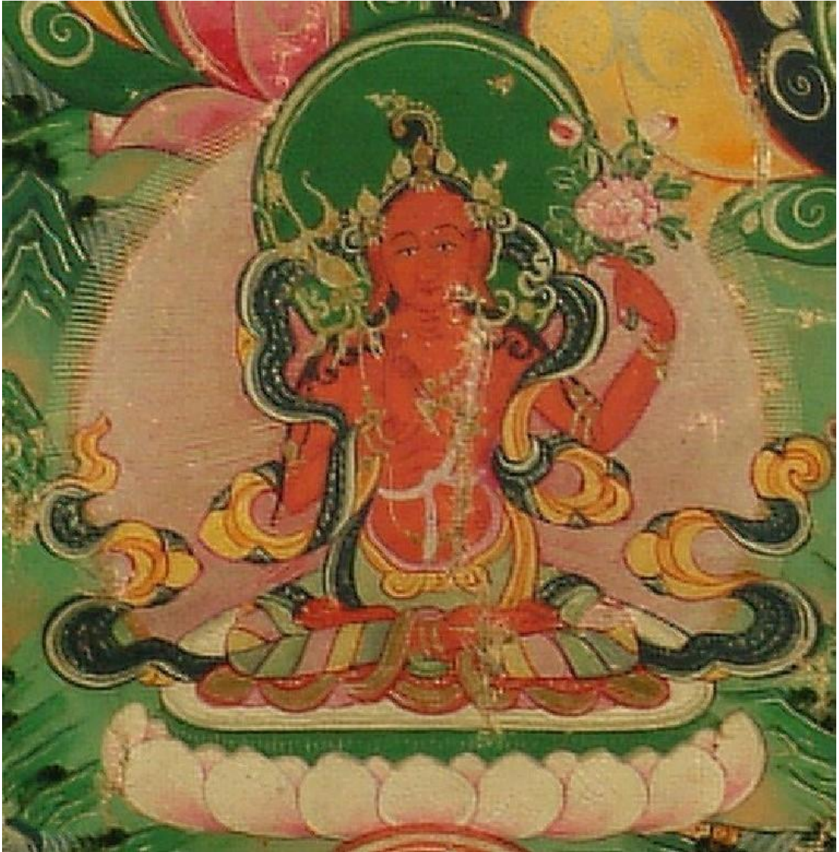
ཚགས་པ་འཛོམས་པའི་སྒྲོལ་མ་

| ལྷག་འཚལ་ཀུན་ནས་བསྐྱར་རབ་དགའ་བའི། | དག་ཡི་ལྷས་ནི་རབ་ཏུ་འགོམས་མ། | ཡི་གེ་བཅུ་པའི་དག་ནི་བཀོད་པའི། | རིག་པ་རྩྭ་ལས་སྒྲོལ་མ་ཉིད་མ། །།༦། །