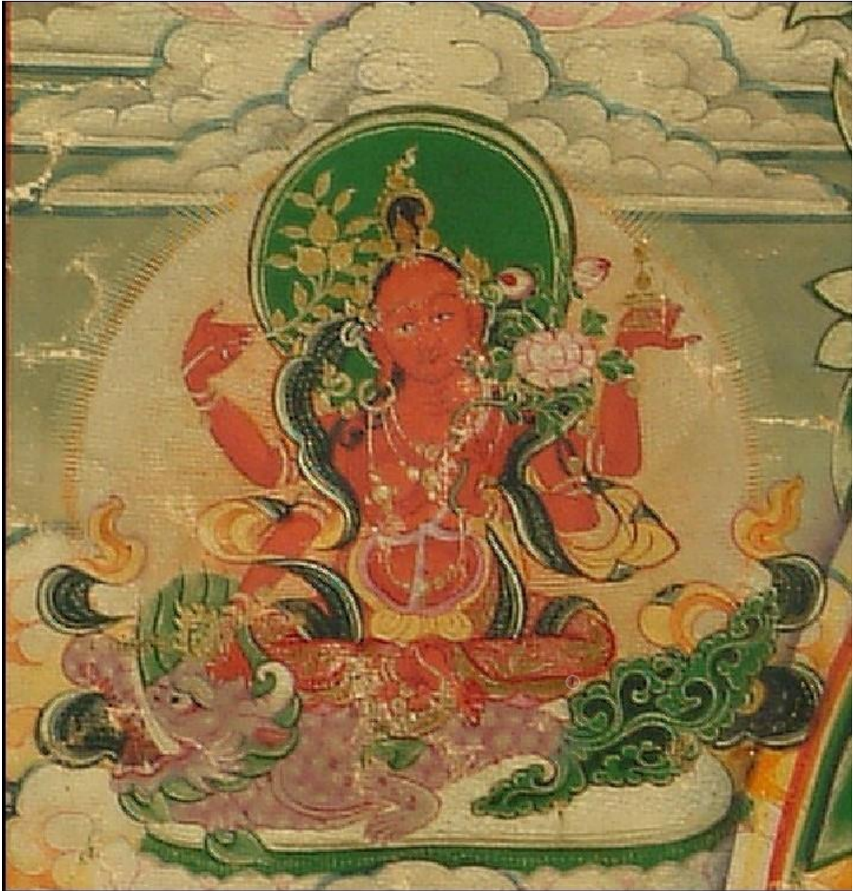
དབང་མཚན་ལྷེར་བའི་སྣོལ་མ་

| ལྷག་འཚལ་ཏུ་རེ་འཇིགས་པ་ཆེན་མོ། | བདུད་གྱི་དཔའ་བོ་རྣམ་པར་འཇོམས་མ། | ལུ་སྐྱེས་ཞལ་ནི་ཁྲོ་གཉེར་ལྡན་མཛད། | དག་བོ་ཐམས་ཅད་མ་ལུས་གསོད་མ། །༥།