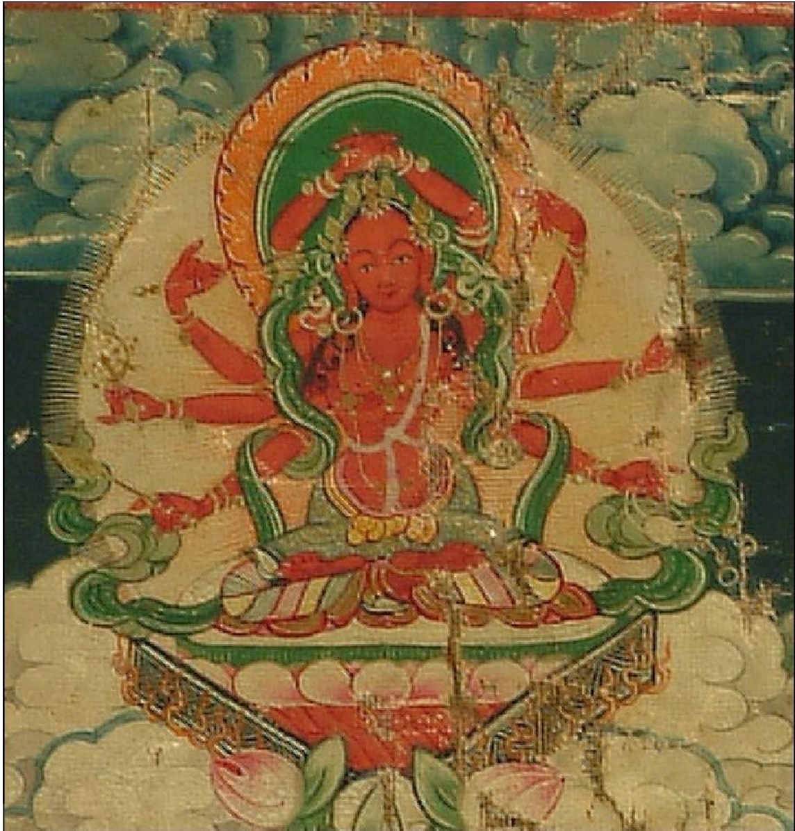
རབ་ཏུ་དཔའ་བའི་སྒྲོལ་མ་

། ཕྱག་འཚལ་སྒྲོལ་མ་ལྷུང་མ་དཔའ་མོ། ། ལྷུན་ནི་སྐད་ཅིག་སྒྲོག་དང་འདྲ་མ། ། འཇིག་རྟེན་གསུམ་མགོན་ཐུ་སྐྱེས་ཞལ་གྱི། ། གོ་སར་བྱེ་བ་ལས་ནི་བྱུང་མ། །།།